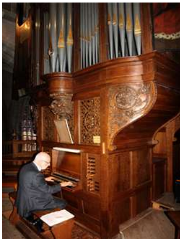
Een sfeerbeeld van dit geweldige concert

En afsluitend de climax van de cyclus - een jubileumconcert om niet meer te vergeten - met de als altijd bevlogen Ton Koopman . Via het beeldscherm konden we deze barokgrootmeester zelf aan het werk zien op het Hulster orgel.